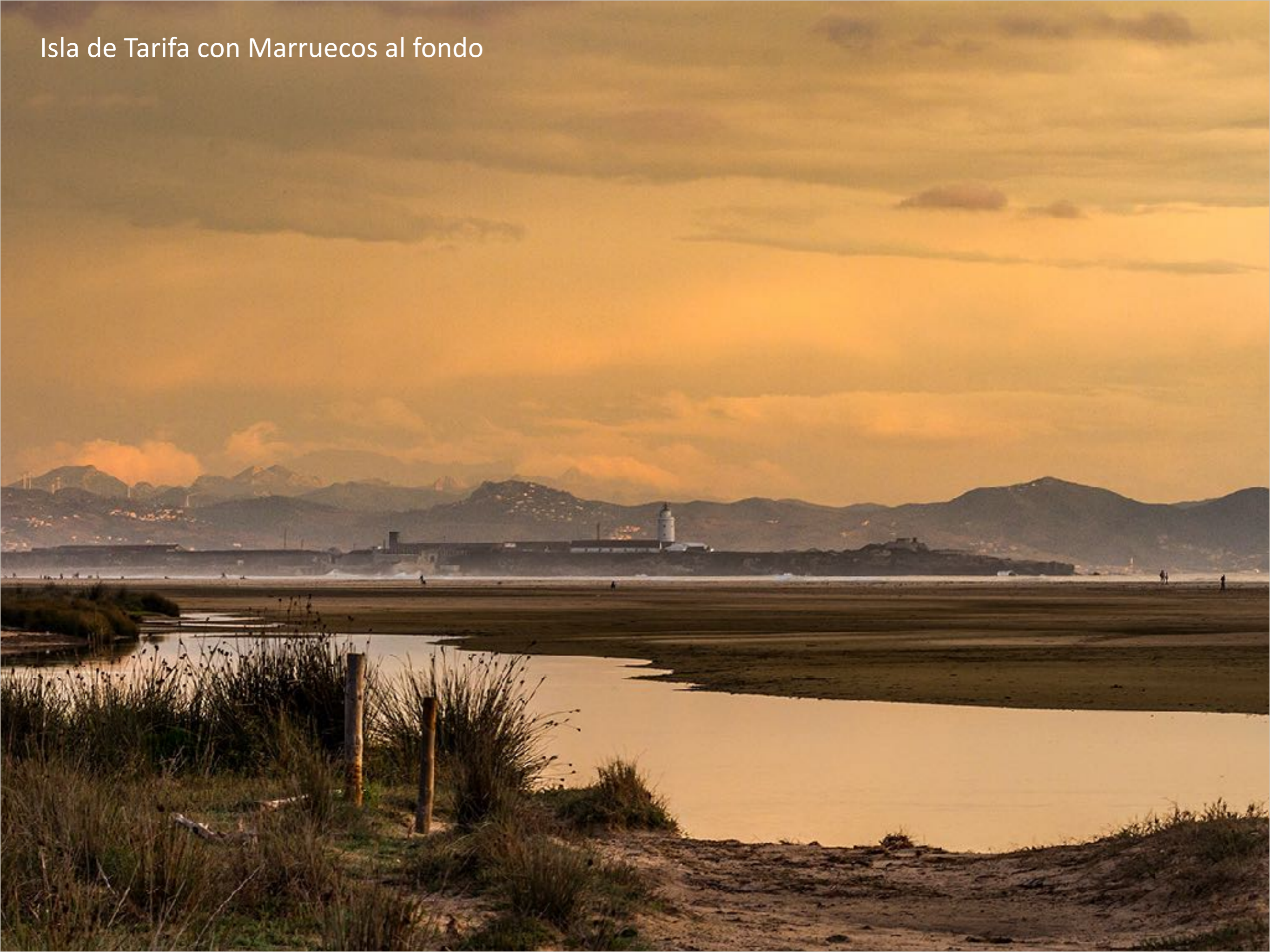
Isla de Tarifa con Marruecos al fondo