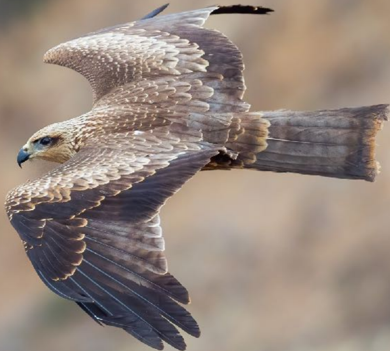
Juvenil de Milano negro en migración